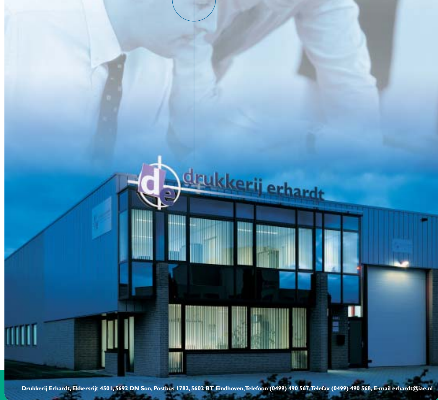
Drukkerij Erhardt, Ekkersrijt 4501, 5692 DN Son, Postbus 1782, 5602 BT Eindhoven, Telefoon (0499) 490 567, Telefax (0499) 490 568, E-mail erhardt@iae.nl

Hoewel onze naam anders doet vermoeden, doet Drukkerij Erhardt meer dan enkel het verzorgen van uw handels- en fullcolordrukwerk. Wij denken met u mee in het gehele traject. Van het ontwerp, de digitale verwerking, de verzorging van het drukwerk, tot en met het opzetten van een voorraadsysteem voor levering op afroep. Ons netwerk van geselecteerde toeleveranciers stelt ons in staat complexe opdrachten te verzorgen. Kortom: Drukkerij Erhardt is een servicegerichte onderneming die een breed scala aan producten en diensten aan kan bieden in de zakelijke markt.